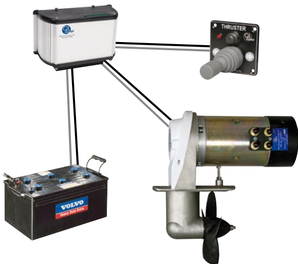
Unidad de control